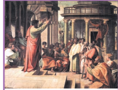
உரு 9.1 கிரேக்கத்தின் எதேன்ஸ் நகர வாசிகள் ஒன்றுகூடி கலந்துரையாடலில் ஈடுபடல்.

உலகின் பழமைவாய்ந்த நாகரிகம் ஒன்றுக்குச் சொந்தமான கிரேக்கத்தின் எதேன்ஸ் மற்றும் ஸ்பாட்டா போன்ற நகர அரசுகளில் நேரடி சனநாயகம் காணப்பட்டுள்ளது. அங்கு ஆட்சி செய்வது தொடர்பில் பிரசைகளின் பங்குபற்றல் பெறப்பட்டுள்ளது. இத்தகைய நேரடி ஆட்சி கி.மு 5ஆம் நூற்றாண்டில் கிரேக்கத்தில் நிலவியது.