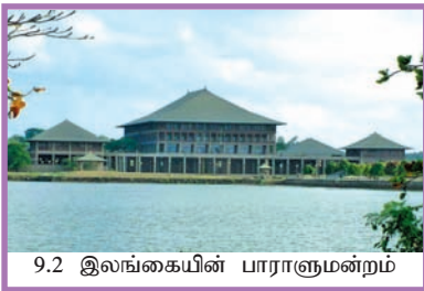
9.2 இலங்கையின் பாராளுமன்றம்

இத்தகைய நேரடி ஆட்சிமுறையை தற்காலத்தில் நடைமுறைப்படுத்துவது தொடர்பாக நீங்கள் சிந்தித்துப் பாருங்கள்.