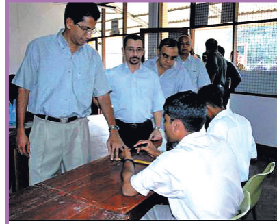
உரு 9.3 வாக்களிப்பு நிலையமொன்று

நாட்டின் ஆட்சி அதிகாரம் மக்களால் தெரிவுசெய்யப்பட்ட பிரதிநிதிகளால் பிரயோகிக்கப்படும் ஆட்சி பிரதிநிதித்துவ சனநாயகம் அல்லது மறைமுக சனநாயகம் எனப்படும். நவீன சனநாயக அரசுகளில் மேற்படி பிரதிநிதித்துவ சனநாயக முறையே பின்பற்றப்படுகின்றமை குறிப்பிடத்தக்கது. வாக்காளர்கள் தேர்தல்கள் மூலம் தேர்தல் தொகுதிகள் சார்பாக தமது பிரதிநிதிகளைத் தெரிவு செய்வர். அவ்வாறு தெரிவு செய்யப்பட்ட பிரதிநிதிகள் ஆட்சிப்பணியை மேற் கொள்வர். இதன்படி இத்தகைய ஆட்சி முறையில் மக்கள் ஆட்சி நடவடிக்கைகளில் மறைமுகமாகத் தொடர்புபடுகின்றனர்.