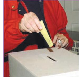
9.5 வாக்களர் ஒருவர் வாக்களிக்கும் சந்தர்ப்பம்

இலங்கை பிரித்தானியரின் ஆட்சிக்கு உட்பட்டிருந்த போது கி.பி 1910 ஆம் ஆண்டில் வழங்கப்பட்ட அரசியல் யாப்புச் சீர்திருத்தத்தின் மூலம் ஏற்படுத்தப்பட்ட சட்டசபைக்கு சிறு பகுதியினரைத் தெரிவு செய்வதற்கு வரையறுக்கப்பட்ட வாக்குரிமை வழங்கப்பட்டிருந்தது. இதன் மூலம் கல்விகற்ற சொத்து வருமானமுள்ள ஆண்கள் மட்டும் வாக்குரிமையைப் பெற்றனர். இவ் வாக்குரிமை முறையால் மக்கள் தொகையில் சுமார் நான்கு சதவீதமானோர் மட்டுமே வாக்குரிமை உடையோராக விளங்கினர்.